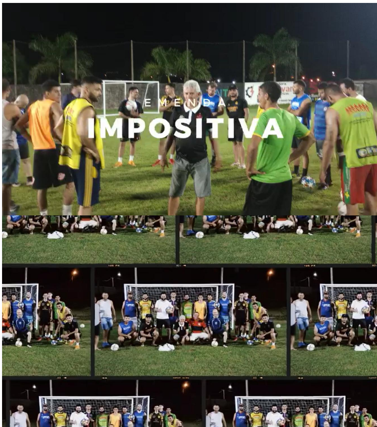
ENTREGA KITS AOS ATLETAS DE FUTEBOL AMADOR DE ESPIGÃO DO OESTE